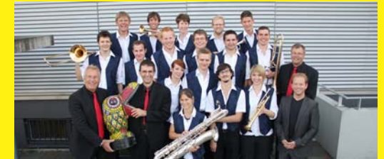
Big Band der Jugendmusik Zürich 11